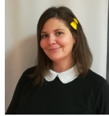
Charlotte Animatrice Atsem