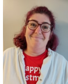
Stéphanie Restauration Scolaire et Entretien