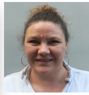
Angélique Restauration Scolaire et Entretien