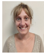
Nina Restauration Scolaire et Entretien